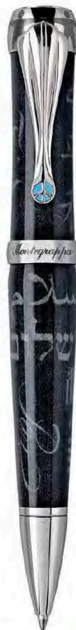
Sfera a rotazione Twist Action Ballpoint Pen