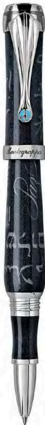
Roller Rollerball Pen