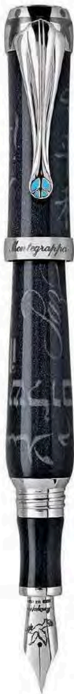
Penna Stilografica Fountain Pen