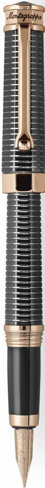
Penna Stilografica Fountain Pen