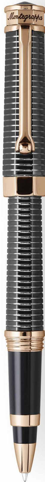
Roller Rollerball Pen