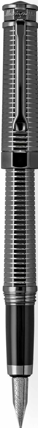
Penna Stilografica Fountain Pen