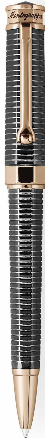
Sfera a rotazione Twist Action Ballpoint Pen