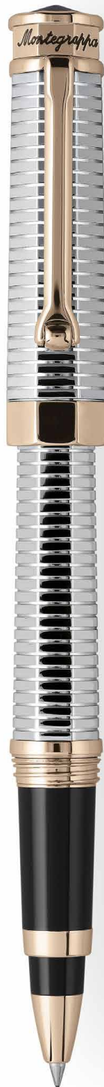
Roller Rollerball Pen