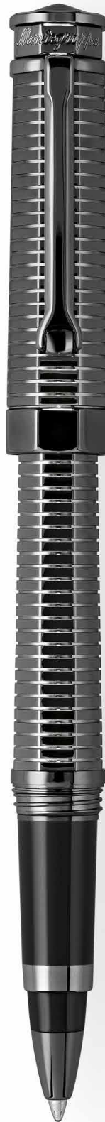
Roller Rollerball Pen