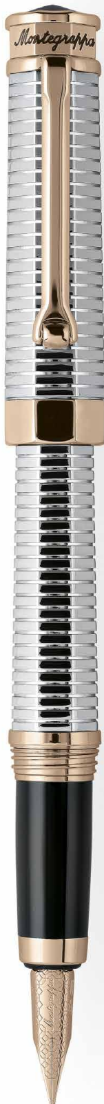
Penna Stilografica Fountain Pen