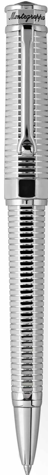
Sfera a rotazione Twist Action Ballpoint Pen