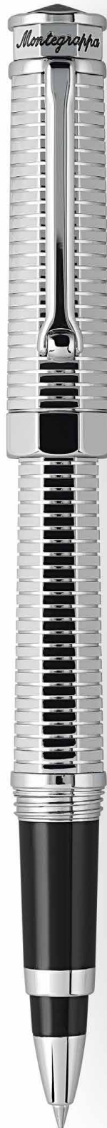
Roller Rollerball Pen