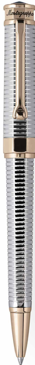
Sfera a rotazione Twist Action Ballpoint Pen