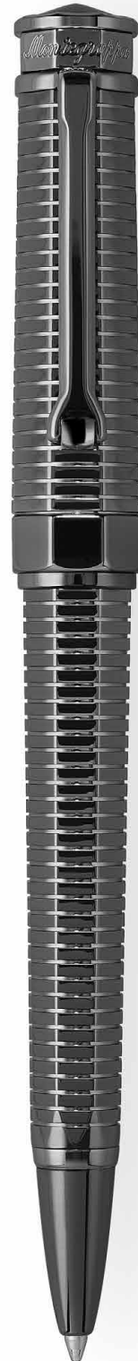
Sfera a rotazione Twist Action Ballpoint Pen