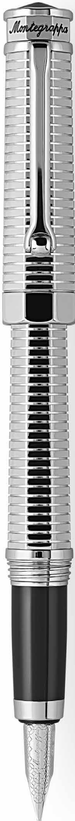
Penna Stilografica Fountain Pen