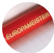
ЛАЗЕРНЕ ГРАВІЮВАННЯ ЗАЛИВКОЮ КОЛЬОРОМ