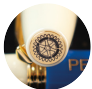
ЛАЗЕРНЕ ГРАВІЮВАННЯ НА МЕТАЛІ